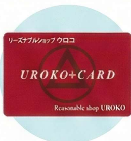
チャージ式の ウロコプラスカード