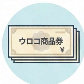
紙タイプの ウロコ商品券